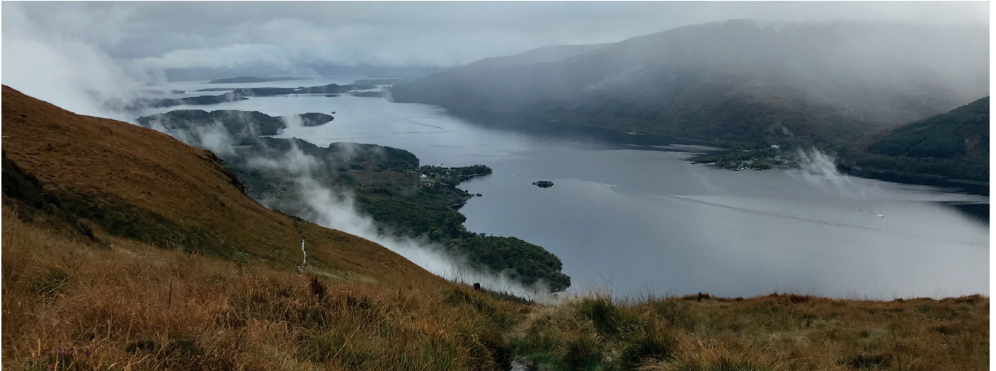
Loch Lomond im Nebel